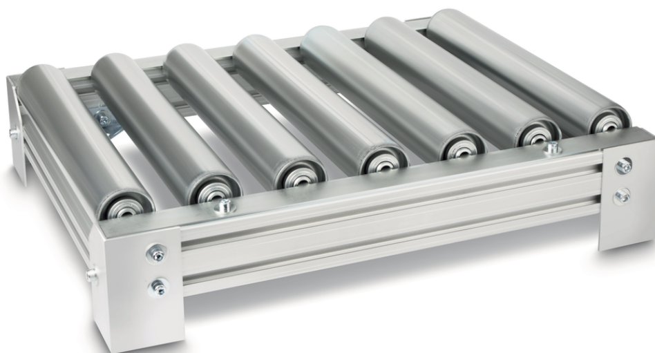
Trasportatore a rulli KERN YRO-02