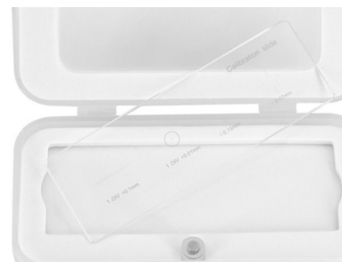
Accessori: Micrometro oggetti – Per la calibrazione della funzione di misurazione del software, KERN ODC-A2404

Queste fotocamere universali possono essere anche collegate a tutti i microscopi reperibili sul mercato tramite un adattatore per camera idoneo al microscopio in uso.